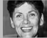
BERN/BIEL: VAUCHER SPORT SPECIALIST