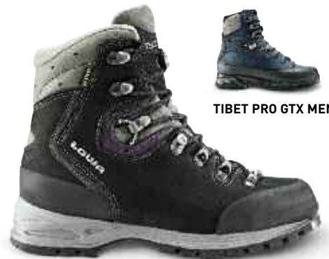
TIBET PRO GTX MEN