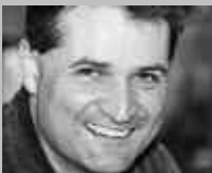
LIESTAL: SPORT BYM TÖRLI