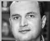
LUZERN: VON MOOS SPORT