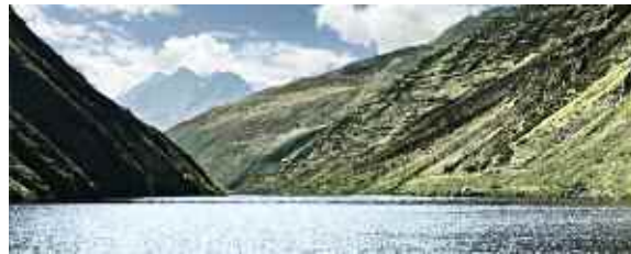
Ihr Bernhard Russi

und passionierte Berggänger, die auf hunderten von Touren schon unzählige Abenteuer erlebt haben. Sie wissen genau, worauf es ankommt, und verkaufen nur das, was sie selbst getestet haben. Das habe ich selbst erfahren, als ich zusammen mit diesen Outdoor-Spezialisten in der Nähe meiner Heimat unterwegs war. Es ist beeindruckend, wie viel sie wissen und mit welcher Erfahrung sie auftrumpfen können. Unsere gemeinsame Tour auf dem Oberalppass hat mir eindrücklich bestätigt, dass es für mich keine besseren Outdoor-Spezialisten gibt. Und für Sie?»