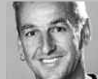
ILANZ: MENZLI SPORT