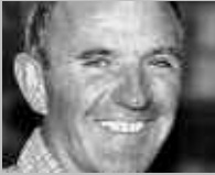
ADELBODEN: OESTER SPORT