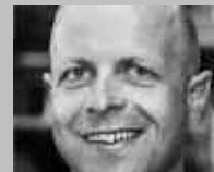
STANS: SKI & SPORT ACHERMANN