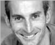
BÜRGLEN UR: IMHOLZ SPORT