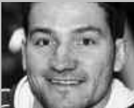
FRUTIGEN: INTERSPORT ZÜRCHER