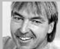
LYSS: HEINIGER SPORT