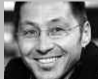
GOSSAU SG: BRAUNWALDER