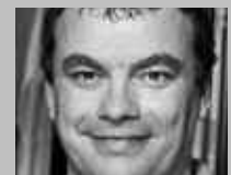
WIL SG: BOSSART SPORT WIL