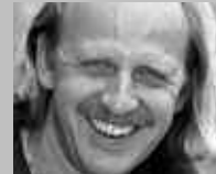
ENGELBERG: TITLIS SPORT