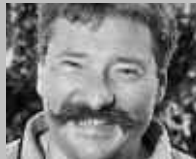
OSTERMUNDIGEN: FRIEDRICH SPORT