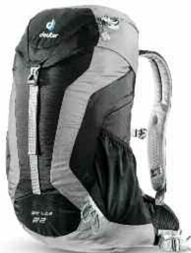
AC LITE 22

Sportlicher Rucksack für Tagestouren. Punktgenaue Ausstattung, leichte Materialien und erstklassige Rückenbelüftung. Deuter-Aircomfort-System. Deckeltasche. Wanderstockhalterung. Regenhülle. 22 Liter. CHF 119.90