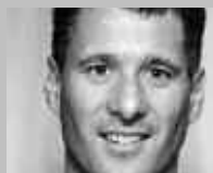
WINTERTHUR: SIRO SPORT