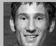
WEINFELDEN: GISIN SPORT