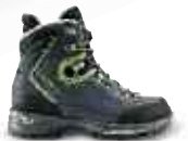
ALBULA GTX WOMEN CHF 349.-