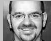
RAPPERSWIL SG: TOWER SPORTS