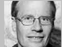
SAAS GRUND: ZURBRIGGEN SPORT