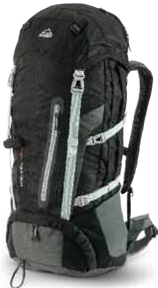
KATMAI 45+8L RC

Moderner Rucksack für mehrtägige Hütten- oder Trekking-Touren mit mittelschwerem Gepäck. ERGO-FIT-Tragesystem mit stark gepolstertem Hüftgurt. Weiche Tragegurte. Atmungsaktives Airmesh-Material. Zusatzösen auf der Deckeltasche. Trinksystemvorbereitung. Wanderstockfixierung. Integrierte Regenhülle. 45 und 8 Liter. CHF 169.-