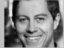
BUOCHS: ARENA SPORT UND OUTDOOR