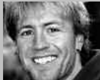
GOLDAU: DOBER TREND-SPORT