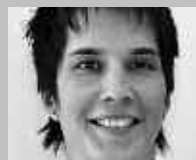
VISP: ABGOTTSPON SPORT