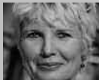
SCHÖNBÜHL- URTENEN: BURKHALTER SPORT