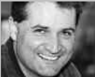
OBERDORF BL: SCHMUTZ SPORT