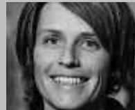
HERZOGENBUCHSEE: INGOLD SPORT + MODE