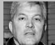
MÜSTAIR: GROND SPORT