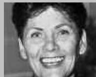
SCHÖNBÜHL SHOPPYLAND: VAUCHER SPORT