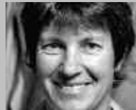
PONTRESINA: FÄHNDRICH SPORT