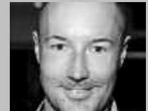
LENK IM SIMMENTAL: TROXLER SPORT UND MODE