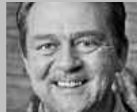
PONTRESINA: GRUBER SPORT