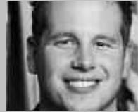
BALSTHAL: SPORTHUS BALSTHAL