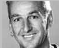
DISENTIS/MUSTÉR: MENZLI SPORT