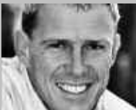
SAMNAUN DORF: HANGL'S SPORT UND MODE