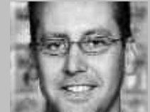
FRAUENFELD: INTER- SPORT FRAUENFELD ADVENTURE SPORTS