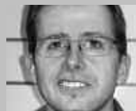
WASEN IM EMMENTAL: KROPF SPORT